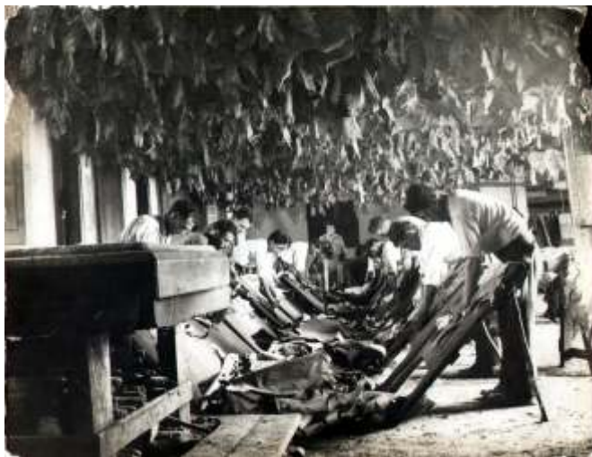
Fotografia da Capa Imagem do Arquivo da CMA | Curtumoteca Doada ao Museu do Curtume por: CARVALHOS SA