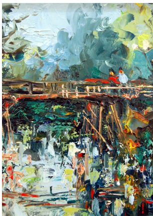
Imagem da capa: pormenor de pintura do Mestre Pedro Olayo (filho) patente na Galeria Municipal Maria Lucília Moita até 13 de janeiro.