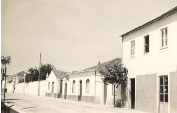
Fotografia da Capa Rua Dr. Oliveira Salazar - Rua 25 de Abril (após revolução), Alcanena, Anos 40.