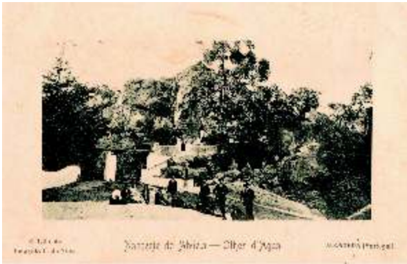
Fotografia da Capa Nascente do Alviela - Olhos d'Água, Alcanena, s/data, de Emygdio L. da Silva. Arquivo CMA