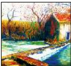
Galeria Municipal Maria Lucília Moita Público Geral 1 a 31 ago RETROSPETIVA DE PINTURA DO ACERVO MUNICIPAL Exposição de Pintura