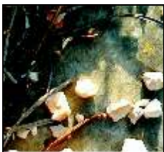
Galeria Municipal Maria Lucília Moita Público Geral 5 a 25 jul :: INAUGURAÇÃO às 18H00 PEDRARVORE FOTOGRAFIA Exposição de Fotografia Rui Gonçalves